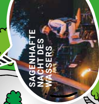
SAGENHAFT NACHT DES WASSERS